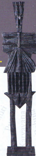
優波離 (十大弟子) Upali (Great disciple of Buddha)

長い間の夢でしたニューヨークでの個展が実現しそうです。今、図録が完成し、作品梱包のための運送会社渡しも終わり、準備完了といったところです。NY展は九州彫刻家連盟を結成し、アート・ナウ展として九州各地の美術館を巡回していた頃(1975年)からの夢でした。NYには知人もなく個展会場をさがすことから皆目見当もつかず、ギャラリーを重ね合わせて表現しました。NYの画廊の数が多くても開催できるのは非常に幸運でした。この感動を是非意義あるものにしたいたいという制作に集中しました。私はこの十年「自刻像」を主体に制作にしてきました。今回はこの「自刻像」を下敷に釈迦の「十大弟子」のパーソナリティーを重ね合わせて表現しました。私の通った歳月や心の彷徨が十人の弟子の生きざまと重なり自刻像となりました。十大弟子はテーマとしても造型的にもとても魅力のあるものです。しばらくは没頭すると思います。今回の制作の意図を明確にするため材質や色彩などの表現手法を極力抑制したものにしました。素材はブロンズや石や合成樹脂ではなく、八丈和紙を使いました。和紙で彫刻を作るのは初めてのことで強度や光の効果や材質感等未知のもので試行錯誤を繰り返しました。テーマの追究や技術的苦心も大変でしたが、なんといっても「彫刻」をNYに送ることが大変で、とても数量の及ぶところではありませんでした。梱包・通関・輸出申請・NYでの作品保管・梱包等様々な規則や制約が押し寄せて汗がでました。今、私はたくさんの方々に助けをいただいで、ここまで順調にこれたと感謝しています。これらのお力添えに応えるためにも、是非NYで頑張れ成功させたいと願っています。