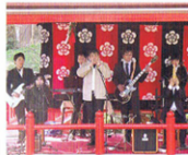
恋木神社奉納ライブ