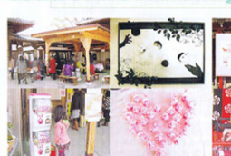
第4回 高校生ポストカード展 審査結果