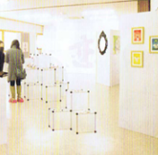
恋グル... 恋のテーマで、恋の物語を表現する...