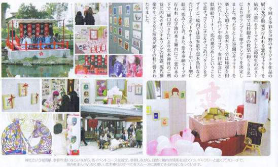
神社と自然、制作活動などから得られた、色やイメージを記憶、思い出しながら、自由に創作的表現を膨らませ、ギャラリーと繋ぐフロアで、展示を体験する。多くの人々も、恋木神社の空まで恋木バレンタインの空気に包まれていました。

水田天満宮 恋木神社 恋木神社の御神様で ありまふ(恋木)と「恋木」とは金木神社とも 恋木バレンタイン「恋木」が1月10日、 12日、13日の3回開催されることになりま された。この日は恋木神社の境内に直ぐ なる恋木公園を囲む古い時代の建物が 多くあり、神社だけでなく歴史文化の中 で交流の場として休むこと、恋木バ レンタインとして休むことを目的と して開催されています。