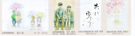
第7回恋木バレンタイン恋のギャラリー 次回、第4回高校生ポストカード展の募集要項は、詳細が決定次第、水田天満宮HPにて発表します。(要申込)

テーマは「恋」。今回は、恋言葉の中の間接と取りましたが、南無とされてすべての方に送られても、良質な作品になりました。